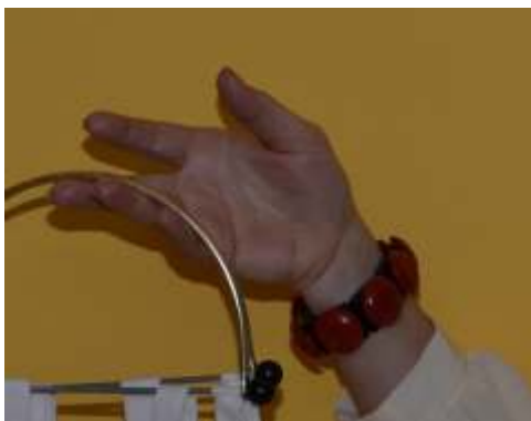
Objekt 2011_010 Taler-Armband