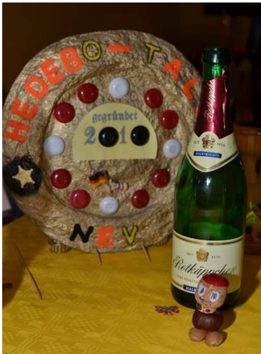
Objekt 2011_001 Vereinswappen (hier mit Korkebmännlein)