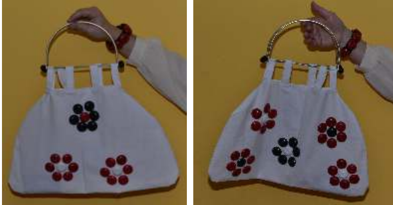
Objekt 2011_007 Bügel-Handtasche