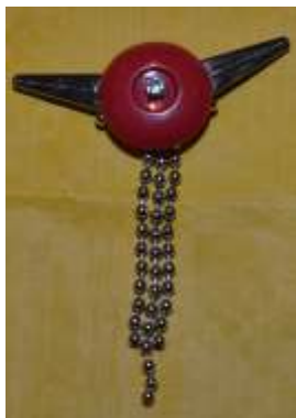
Objekt 2011_009 Kragenklemme