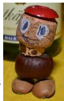
Objekt 2011_006 Korkebmännlein