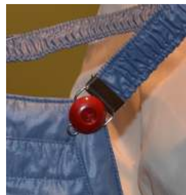
Objekt 2011_004 Knopf