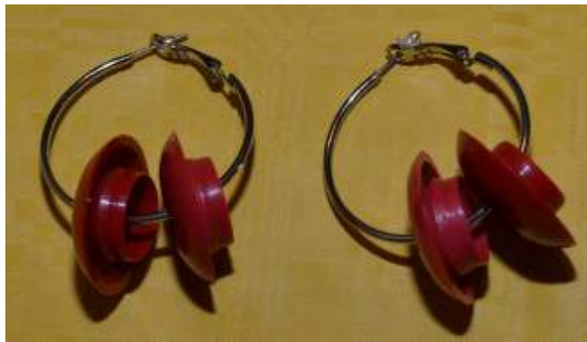
Objekt 2011_008 Ohringe