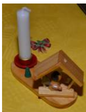
Objekt 2011_002 Kerzenhalter