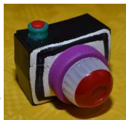
Objekt 2011_005 Kamera