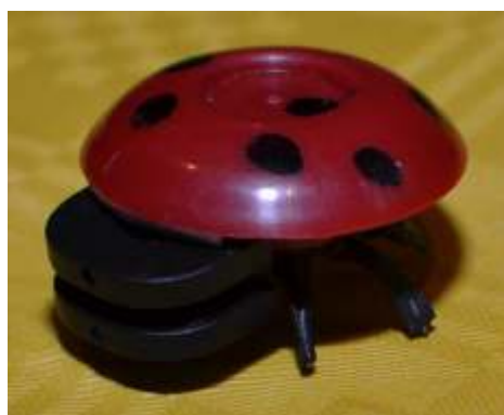
Objekt 2011_003 Käfer